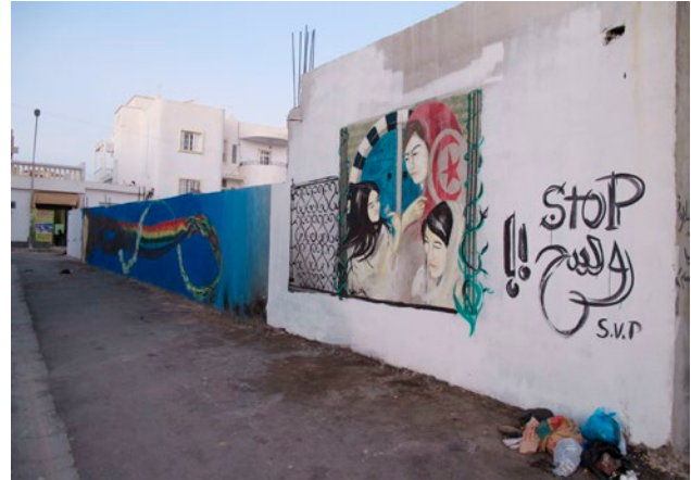
Figura 2. La Via delle Donne nata dal recupero di uno spazio di abbandono dei rifiuti (e visibilmente ancora in parte non riconvertito). Sullo sfondo una delle sedi dell'associazione.

Questa esperienza, specifica e unica all'interno della realtà tunisina, non sembra aver dato luogo a un vero contropotere, anche per la capacità delle istituzioni di volgere a proprio favore i risultati delle diverse iniziati-