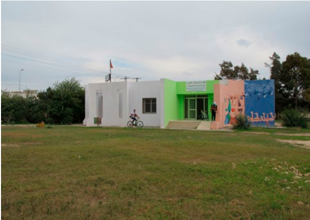
Figura 3. Il centro di educazione ambientale animato dalla associazione all'interno del parco El Montazah ed alcuni giovani Guardie Ambientali volontarie.