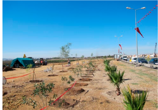
Figura 4. Piantumazione di essenze arboree lungo le sponde della sebkha Sijoumi per la festa degli alberi del 2015.

tunisina. Un lavoro durato oltre un anno e vissuto passivamente dalle diverse istituzioni.