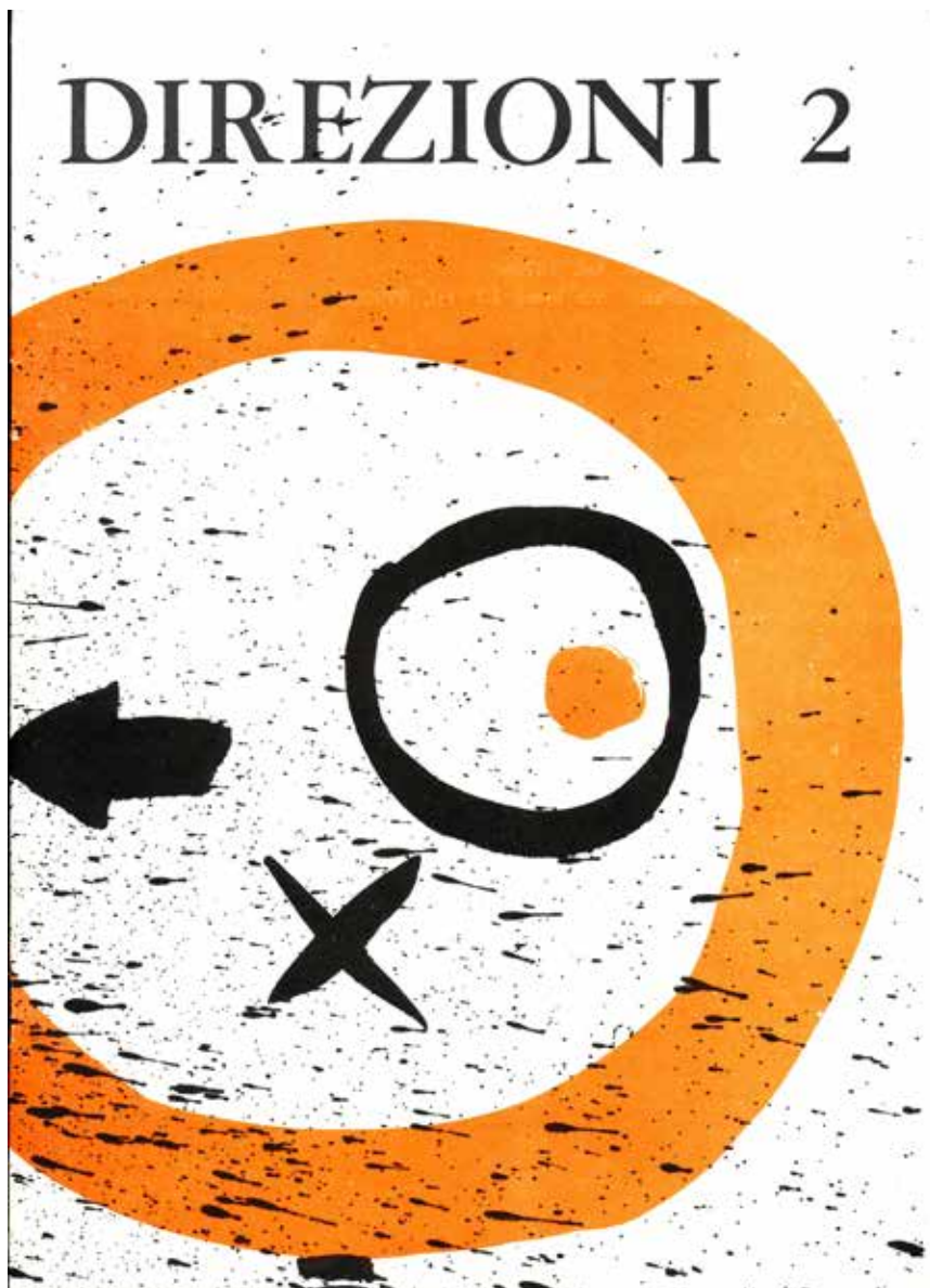
8. Copertina di «Direzioni» n. 2, marzo 1959, illustrata da Enrico Baj.