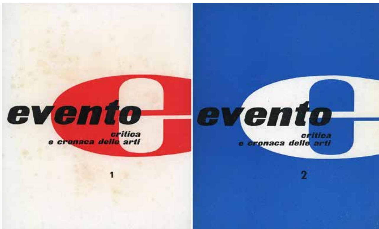
9. Copertine di «Evento», nn. 1-2, novembre-dicembre 1957 e gennaio-febbraio 1958.

L'alleanza tra «Il Gesto», «Phases» e «Direzioni» sembra riconfermarsi fruttuosa anche nel secondo numero, uscito nel marzo del 1959 (fig. 8). Il contenuto del fascicolo, nettamente più ricco del primo, conta autori di recente adesione e altri già attivi ne «Il Gesto» o comunque vicini al Movimento Arte Nucleare, oltre a collaboratori e simpatizzanti di Phases: Jorn, Bertini, Dova, Dangelo, il Gruppo 58, Novelli, Perilli, Toti Scialoja, Elna Riegels, una delle rare artiste donne intorno a Jaguer. 39 Gli scritti, che includono componimenti poetici, testi su artisti, ragguagli e confronti sull'attualità culturale, sono siglati, tra gli