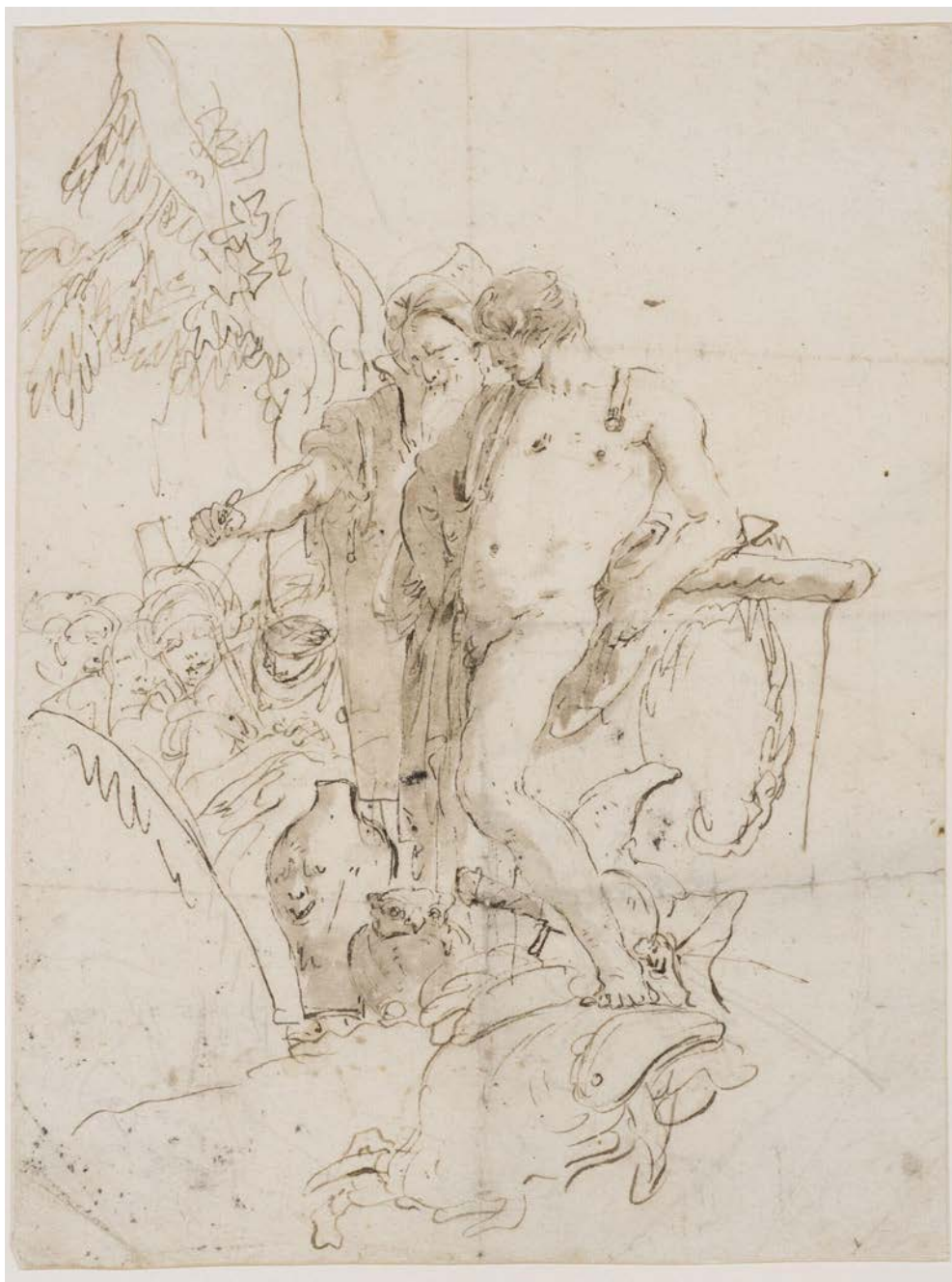
11 | Giambattista Tiepolo, Un mago e un giovane appoggiato ad un'ara (s.d.) , inchiostro e guazzo su carta, Victoria and Albert Museum, London.

essere capaci di descrivere quello che si vede, la prova che ci si disinteressa dei movimenti disordinati 11 ».