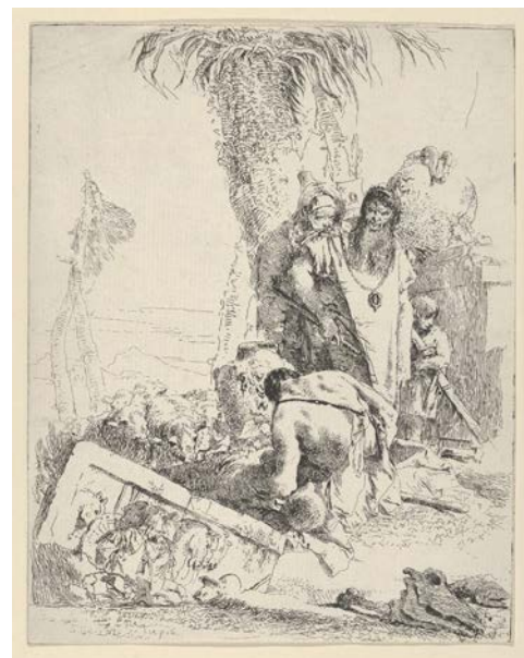
5 | Giambattista Tiepolo, Due maghi e un pastore dagli Scherzi di fantasia (s.d.), The Metropolitan Museum of Art, New York.

Si potrebbe invece intendere questa particolare attitudine come qualcosa di ben più significativo, che ha a che fare con il tratto e la materia stessa dell'immagine incisa, facendo riferimento meno al