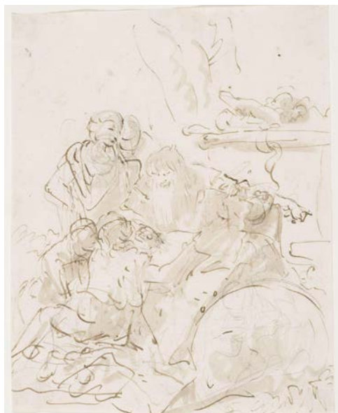
10 | Giambattista Tiepolo, Un mago con un ragazzo e altre figure (s.d.) , inchiostro e guazzo su carta, Victoria and Albert Museum, London.