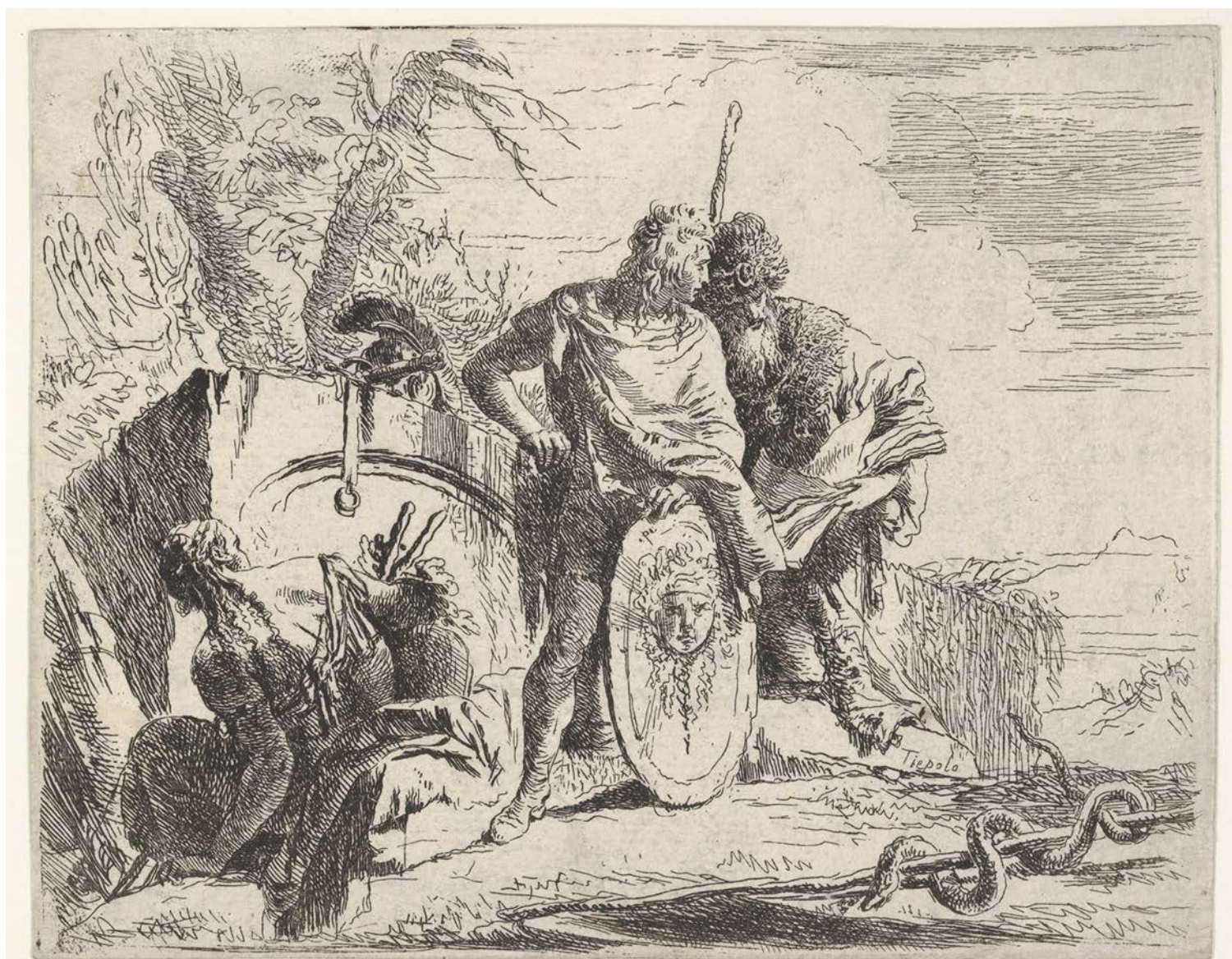
1 | Giambattista Tiepolo, Astrologo e giovane soldato dai Capricci (s.d.t), The Metropolitan Museum of Art, New York. [Nelle schede dei Capricci e degli Scherzi del Metropolitan Museum of Art di New York non è specificata la provenienza dei singoli fogli: si preferisce pertanto non indicare una data].

al tratto adottato da Tiepolo in queste incisioni, considerato meno come un aspetto dell'immagine che come la sua stessa matrice.