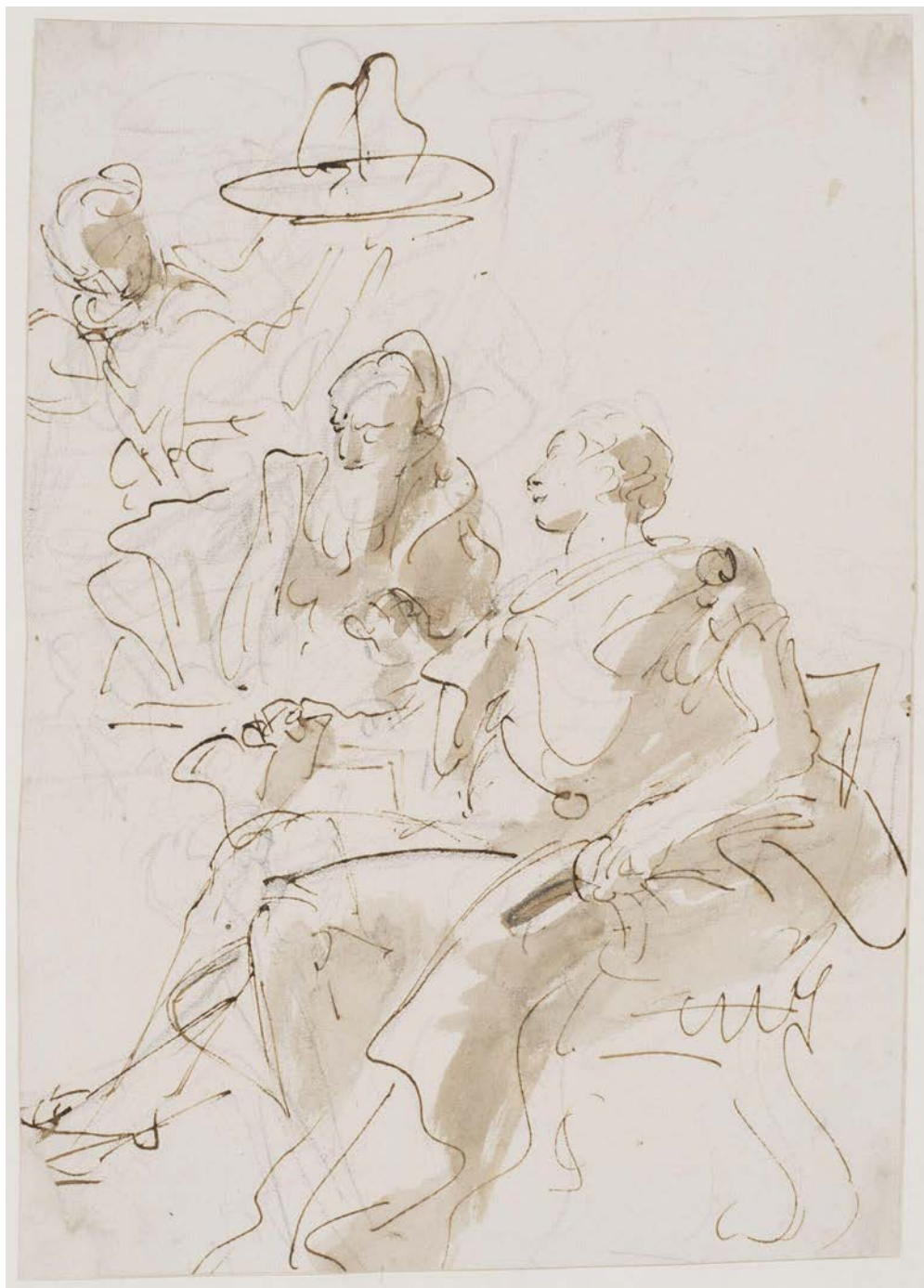
9 | Giambattista Tiepolo, Antonio seduto con un vecchio e un servitore (s.d.) , inchiostro e guazzo su carta, Victoria and Albert Museum, London.

la "prestezza" riferita alla concezione e all'esecuzione dei suoi grandi affreschi. Questa rapidità si può riscontrare ancor meglio negli schizzi: Alpers e Baxandall hanno cercato di darne una descrizione che si potrebbe dire psicofisiologica tentando – peraltro con modesti risultati – di riconoscere i movimenti della mano, e indirettamente del pensiero, esaminando il ductus degli schizzi 9 (figg. 8-11). Disegnare su una lastra per realizzare un'acquaforte è un'operazione certamente più rapida dell'incisione a bulino che presuppone dei disegni preparatori e uno sforzo notevole e prolungato, e però il disegno sulla lastra dell'acqua-